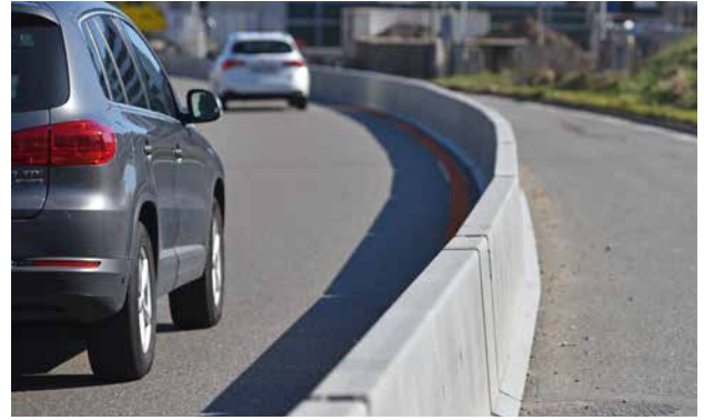
Die Rückhaltesystemlösung Deltabloc® sorgt für hohe Verkehrssicherheit – auch beim Projekt Einhausung Schwamendingen.

In Schwamendingen entsteht neuer, einzigartiger Grünraum. Und zwar über der Autobahn. Dafür wird diese eingehaust. Bis die Bevölkerung den «Überlandpark» nutzen kann, sind anspruchsvolle Herausforderungen zu meistern. Für eine sichere Verkehrsführung kommen umweltfreundliche und nachhaltige Rückhalteelemente aus Beton zum Einsatz. Voraussichtliche Fertigstellung ist im 2024. Kostenpunkt: CHF 445 Mio.