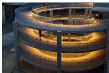
Bild Titelseite: Fussgänger-Passerelle, Attisholz-Areal, Riedholz bei Solothurn; Bauherr: Halter AG, Entwicklung, Hardturmstrasse 134, 8005 Zürich; MÜLLER-STEINAG ELEMENT AG

Vorfabrikate. Aus Beton. Aus der Schweiz. Die richtige Wahl. Dafür stehen wir ein.