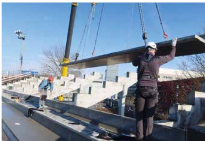
Ein Kranführer und drei Montagemitarbeiter versetzten die rund 153 Betonfertigelemente der offenen Rennbahn in Zürich Oerlikon.