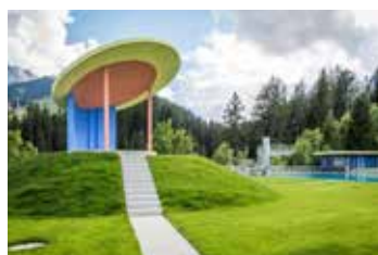
Bild Titelseite: Freibad Gruebi in Adelboden mit vorgefertigten Platten und Blockstufen der Creabeton Matériaux AG.

Vorfabrikate. Aus Beton. Aus der Schweiz. Die richtige Wahl. Dafür stehen wir ein.